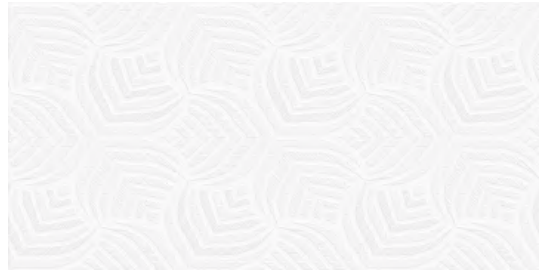
Spike Blanco 12"x24"