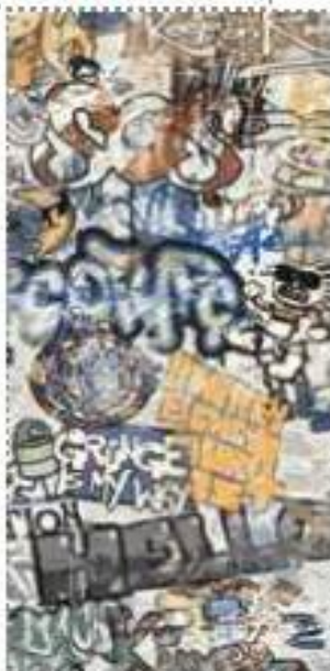
WHITE Decoro Graffiti 120x270