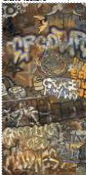
MULTICOLOR Decoro Graffiti 120x270