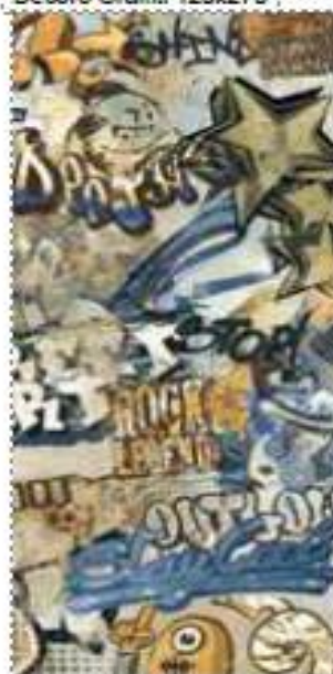
GREY Decoro Graffiti 120x270