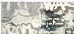
WHITE Decoro Graffiti 60x120