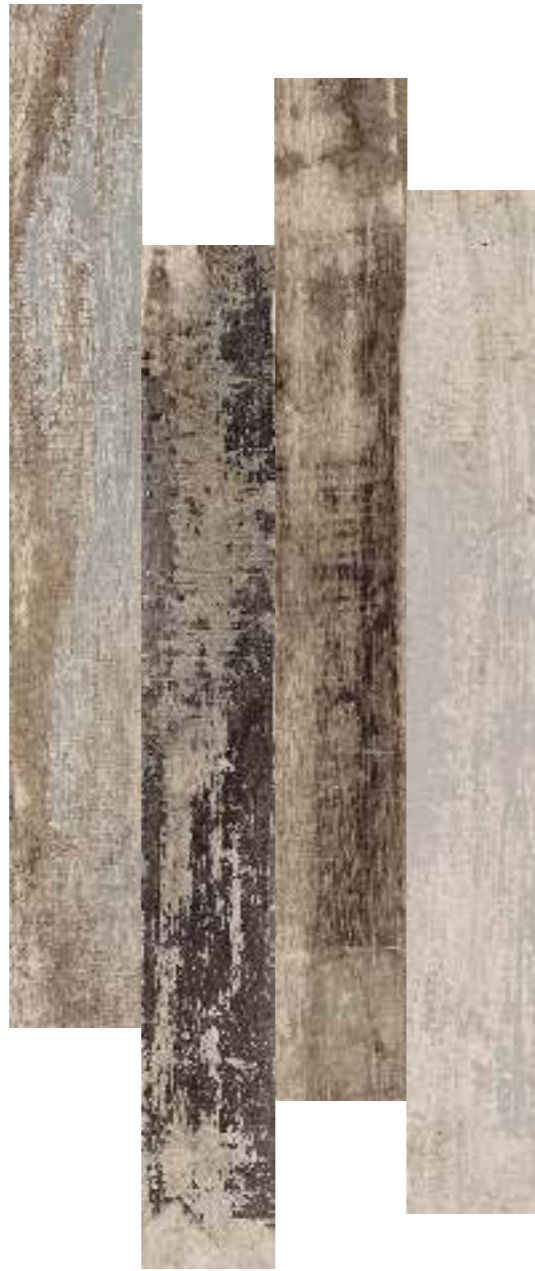
15x120 - 6"x48"