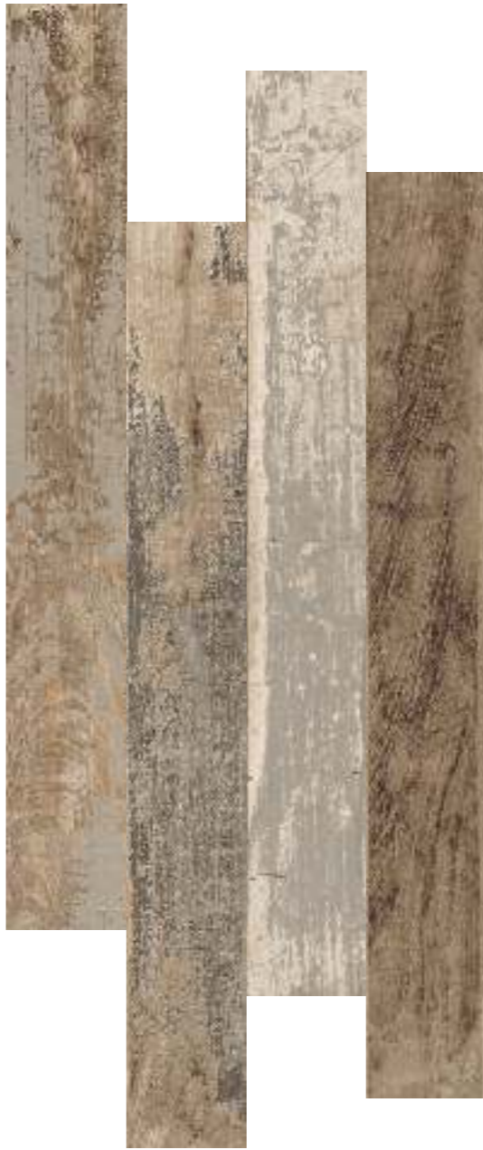
15x120 - 6"x48"