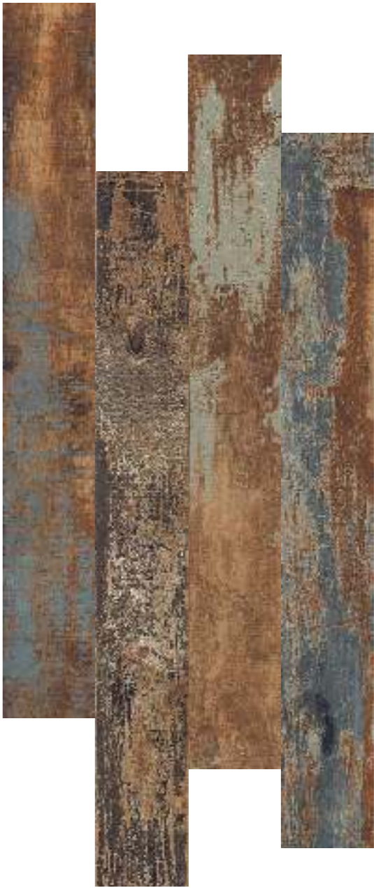
15x120 - 6"x48"