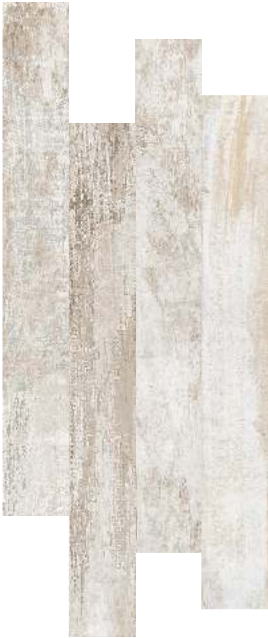
15x120 - 6"x48"