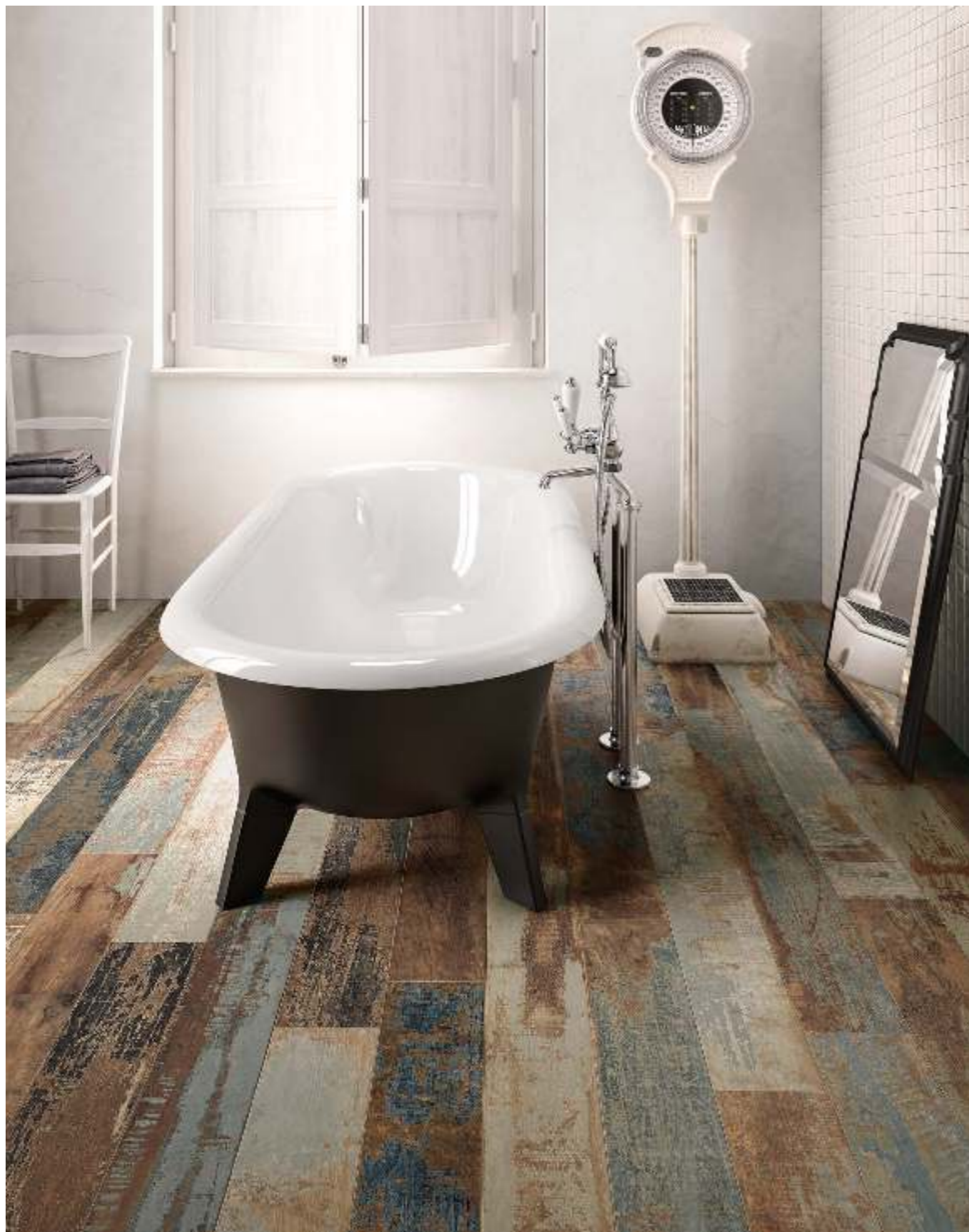
Navy 15120 Wall / Moda Bianco (ABITA Collection)